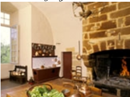
La visite guidée