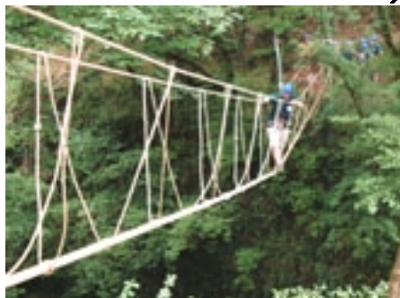
Le grand parc arboré